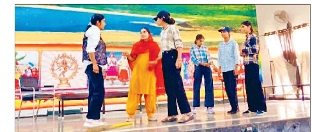
रतिया। महिला कॉलेज में लघु नाटिका प्रस्तुत करती छात्राएं।

शहीद दविन्द्र सिंह राजकीय स्नातकोत्तर महिला महाविद्यालय, रतिया में नशा जागरूकता अभियान के अंतर्गत महाविद्यालय के सांस्कृतिक विभाग और नशा जागरूकता प्रकोष्ठ के संयोजन में लघु नाटिका का मंचन किया गया। इस नाटिका का उद्देश्य विद्यार्थियों और समाज में बढ़ती नशे की प्रवृत्ति के प्रति जागरूकता फैलाना था। नाटिका के माध्यम से यह संदेश दिया गया कि नशा व्यक्ति, परिवार