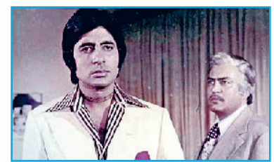
'त्रिशूल' में अमिताभ के पिता के किरदार में संजीव कुमार

दूसरे को कह देते थे-संजीव कुमार बन रहे हो? संजीव कुमार के द्वारा निभाए गए यादगार किरदारों में 'मौसम' के डॉक्टर अमरनाथ को कैसे भूला जा सकता है? इस फिल्म में उनका डबल रोल, शर्मिला टैगोर के रोल से किसी तरह से कमतर नहीं रहा। इसी तरह फिल्म 'त्रिशूल' तो अमिताभ की कही जाती है, लेकिन इसमें संजीव कुमार ने एक ऐसे व्यापारी का रोल प्ले किया, जो अंजाने में ही अपने बेटे से व्यापारिक संघर्ष कर रहा होता है और उसे पता ही नहीं चलता। इसमें पिता-पुत्र के संवाद, दो प्रतिद्वंद्वी व्यापारियों को उस लड़ाई का प्रतिनिधित्व करते हैं, जिसमें वे अपनी जीत के लिए किसी भी स्तर तक जा सकते हैं। उन पर फिल्माए गाने भी हुए हिट: संजीव कुमार पर फिल्माए गाने भी सुपरहिट रहे। 'अनोखी रात' का गीत 'ओह रे ताल मिले नदी के जल में, नदी मिले सागर में', 'खिलौना' का 'खिलौना जानकर तुम तो', 'सीता और गीता' का 'हवा के साथ-साथ, 'मेरी भीगी भीगी सी पलकों पे', 'आंधी' का 'तुम आ गए हो, नूर आ गया है', 'मौसम' का 'दिल ढूँढता है फिर वहीं फुसंत के रात-दिन' और 'सिलसिला' का 'रंग बरसे', हर दौर के हिट गानों की श्रेणी में गिने जाते हैं। अधूरी रही प्रेम की दास्तान: संजीव कुमार ने जिस तरह से फिल्मों में अपना परचम लहराया, उसी तरह से उनके प्रेम के चर्चे भी खूब सुने जाते रहे। हेमा मालिनी के साथ के किस्से तो सर्वाधिक चर्चित रहे ही हैं। सुलक्षणा पंडित के साथ भी उनकी जोड़ी चर्चित रही पर वह भी अपने मुकाम पर पहुंचने से रह गईं। खुद के बारे में भी कई अपनो ही भविष्यवाणी को सच साबित करते हुए जीवन के पचास बसंत पूर्ण करने से पहले ही 6 नवंबर 1985 को अनंत आकाश में हमेशा-हमेशा के लिए विलीन हो गए। k