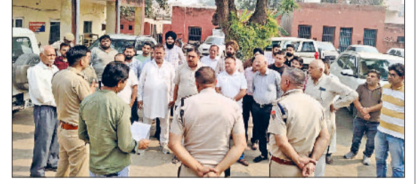
फतेहाबाद। शहर के दवा विक्रेताओं को प्रतिबंधित दवाएं न बेचने का संकल्प दिलाते पुलिस अधिकारी।