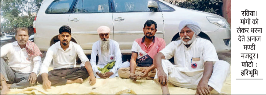
रतिया। मांगों को लेकर धरना देते अनाज मंडी मजदूर।

मार्केट कमेटी में लगातार हरियाणा मजदूर यूनियन के बैनर तले मजदूरों की मांगों को लेकर धरना जारी है। प्रशासन की ओर से मजदूरों की समस्याओं के प्रति अब तक कोई ठोस रुचि नहीं दिखाई गई है, जिससे मजदूरों में भारी नाराजगी है। आज यूनियन प्रतिनिधियों की सचिव से मुलाकात हुई, जिसमें सचिव ने मजदूरों के कार्ड बनाए जाने के लिए