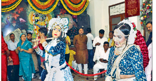
सिरसा। प्राचीन श्याम मंदिर में आयोजित कार्तिक मेला महोत्सव में राधाकृष्ण महारास नृत्य करते कलाकार।

नोहरिया बाजार स्थित प्राचीन श्री श्याम मंदिर में चल रहे चार दिवसीय कार्तिक मेला महोत्सव के तीसरे दिन मंदिर प्रांगण में बाबा के श्रद्धालुओं की गहमा-गहमी रही।