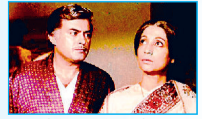
'आंधी' में सुवित्रा सेन के साथ संजीव कुमार

सुपर स्टार का ग्लैमर, हिट कराने का तमगा और स्लिम-टिम फिगर अगर किसी हीरो की इमेज को एक डेकोरम देता है, तो किसी भी भूमिका को परफेक्ट तरीके से करना भी किसी फिल्म को हिट कराने की गारंटी हो सकती है। यह बात सिद्ध की थी संजीव कुमार ने। वह एक ऐसे कलाकार थे, जिनके बारे में कहा जाता था कि वे कोई रोल निभाते नहीं, उसे पूरी तरह जीते थे। जिस तरह हिंदी फिल्म इंडस्ट्रीज में दिलीप कुमार, अमिताभ