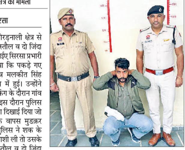
सिरसा। अवैध पिस्तौल व कारतूस सहित पकड़ा गया आरोपी।