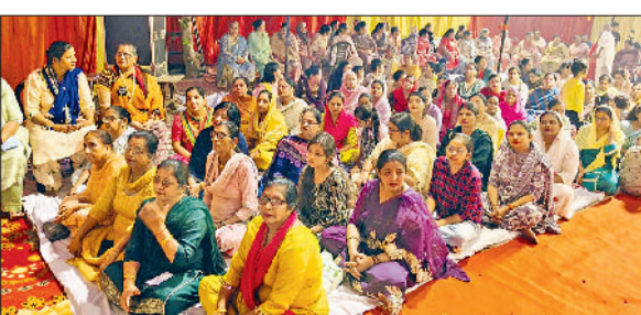
रतिया। कार्यक्रम में उपस्थित श्रद्धालुगण।